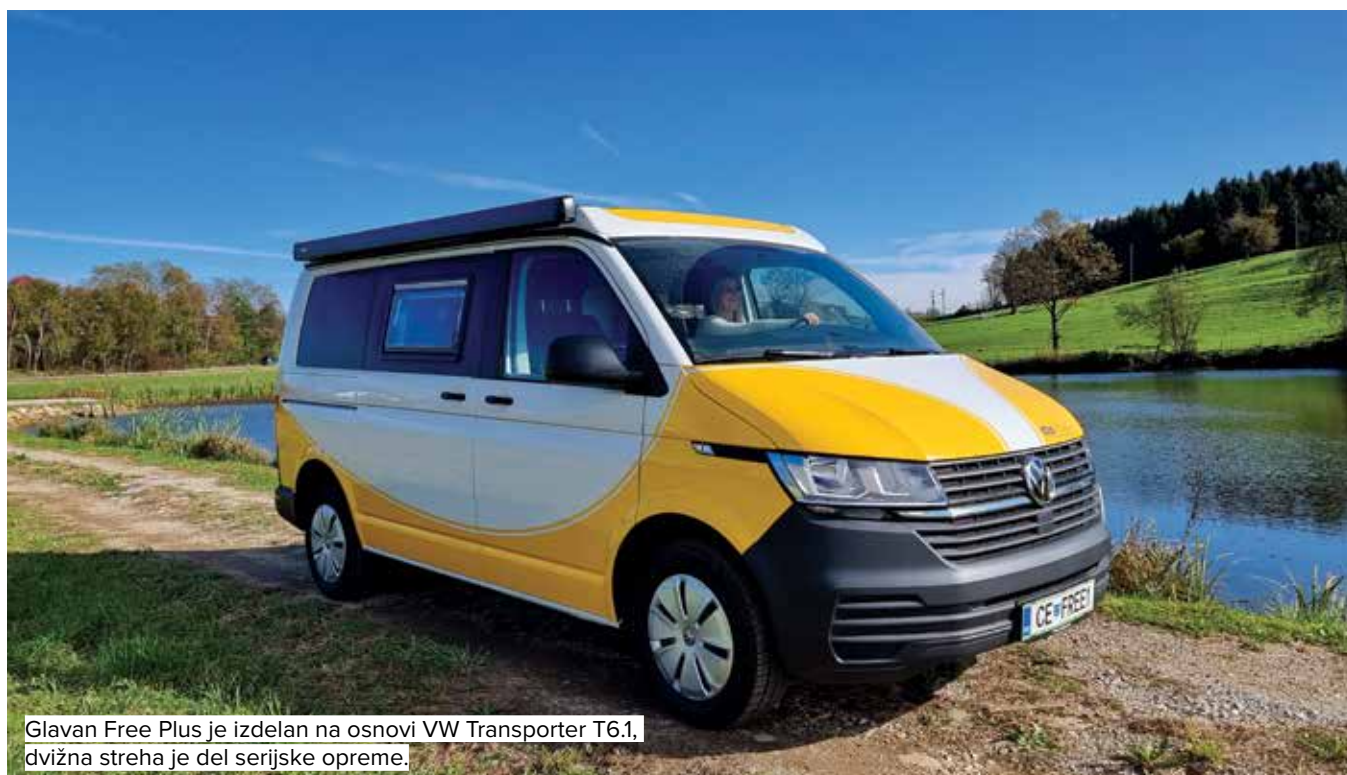
Glavan Free Plus je izdelan na osnovi VW Transporter T6.1, dvizna streha je del serijske opreme.

T uji predelovalci potovalnikov imajo v ponudbi vozila tudi na osnovi drugih malih kombijev, denimo na Citroënih, Toyotah ali Fordih, nekateri celo na Renaultih. Pri AC Glavan prisegajo na Volkswagen T6.1. in so eni redkih, ki v Sloveniji izdelujejo potovalnike.