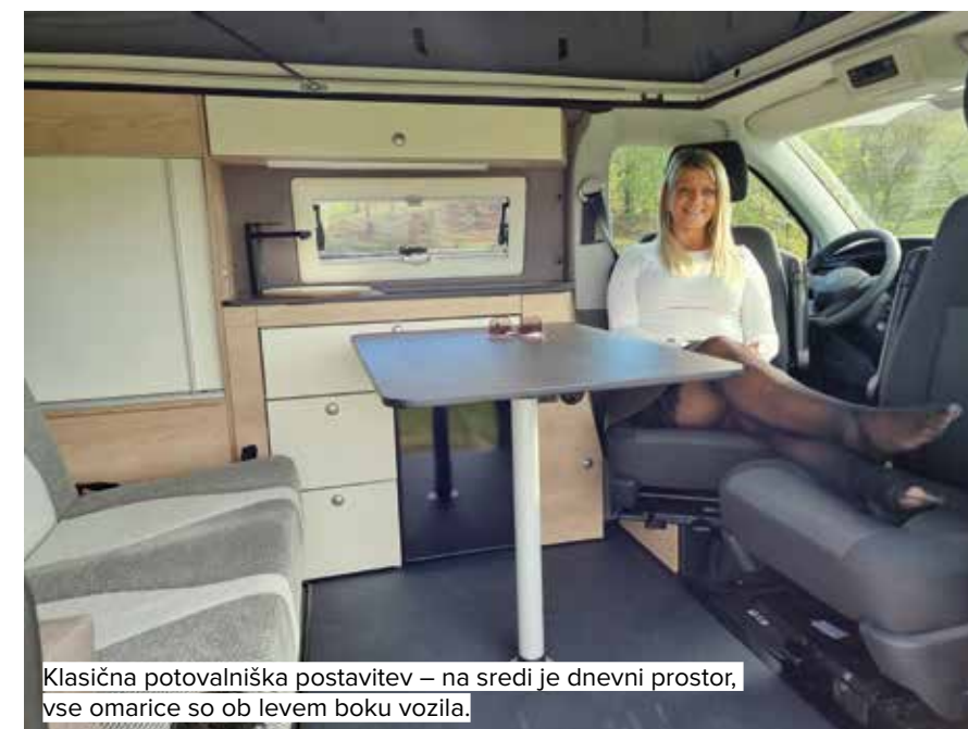
Klasična potovalniška postavitve – na sredi je dnevni prostor, vse omarice so ob levem boku vozila.

Ker sem ženska, v počitniških vozilih vedno najprej preverim, koliko prostora je v omarah, omaričah in prtljažniku. Medtem, ko moje kolegice najprej preverijo, kakšne so zavese in oblažinjene, je meni najvažnejše, kam bom lahko pospravila vso »kramo«. Nenazadnje je počitni-