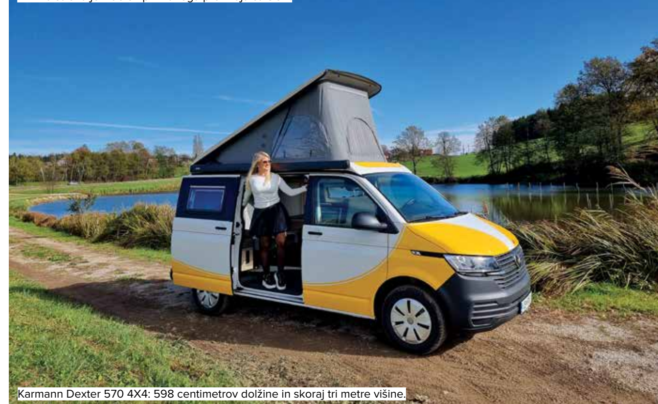
Karmann Dexter 570 4x4: 598 centimetrov dolžine in skoraj tri metre višine.